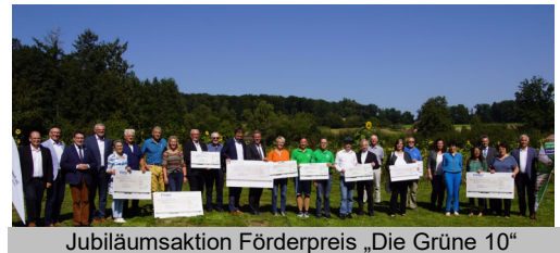
Jubiläumsaktion Förderpreis „Die Grüne 10“