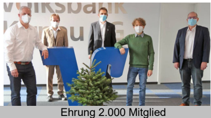
Ehrung 2.000 Mitglied

Eine spannende Entwicklung, die es der Energie + Umwelt eG auch wieder ermöglicht Photovoltaik-Projekte wirtschaftlich umzusetzen.