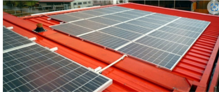
Feuerwehr, Gemeinde Werbach 29,61 kWp