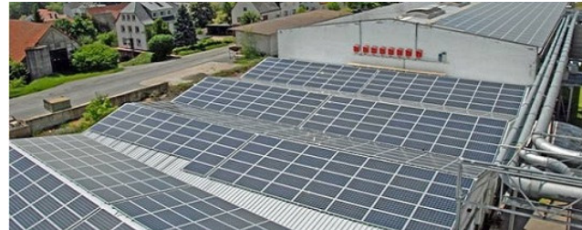
Bürgeranlage Fertig, Buchen 1.080,40 kWp