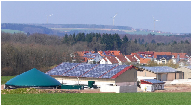
Gülleverdelungsanlage und PV Hof Schönit, Buchen