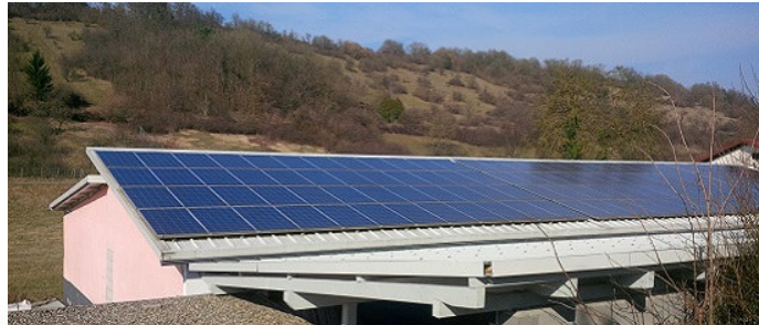
Bürgeranlage Tierheim, Dallau 27,60 kWp