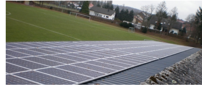
Sportheim, Mudau 29,64 kWp