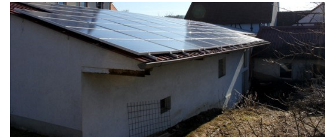
Bürgeranlage Bauhof, Eubigheim 35,19 kWp